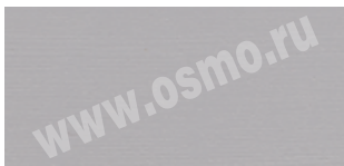
3188 : 3169 | 10 : 1