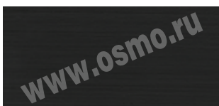
Dekorwachs 3169 Черный

Совет: Запишите информацию о соотношении цветовых компонентов, чтобы в случае необходимости вы могли наиболее точно воссоздать необходимый цвет.