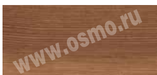
3111 : 3138 | 1 : 10