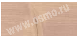
3111 : 3138 | 3 : 1