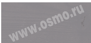
3188 : 3169 | 3 : 1