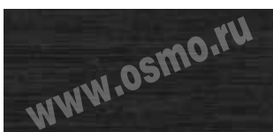
3188 : 3169 | 1 : 10