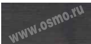
3188 : 3169 | 1 : 3