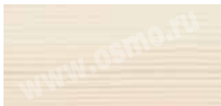
Dekorwachs 3111 Белый | 1 слой