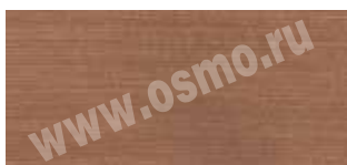
3111 : 3138 | 1 : 3