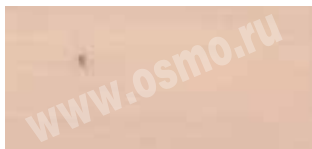
3111 : 3138 | 10 : 1