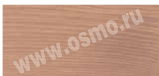
3111 : 3138 | 1 : 1