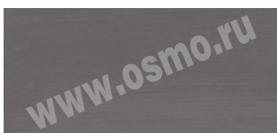
3188 : 3169 | 1 : 1