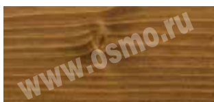
Dekorwachs 3138 Махагон